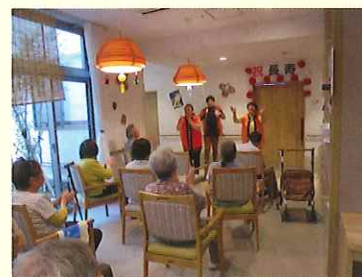
敬老会 職員による踊りを皆で楽しみました。