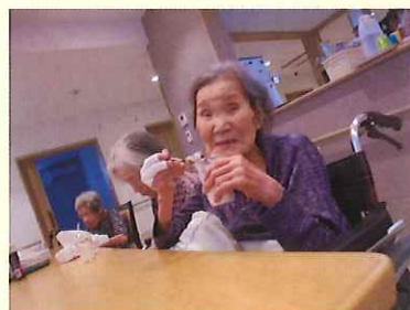
夏のおやつレク かき氷を食べました