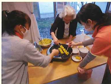
秋のおやつレク スイートポテトを作りました